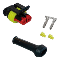
Ref. DY-201545A Kit de Reparación Conector SuperSeal Hembra 2 vías

Luz de Gálibo Delimitación de Anchura Derecho LED 500mm cable conector SuperSeal 24V